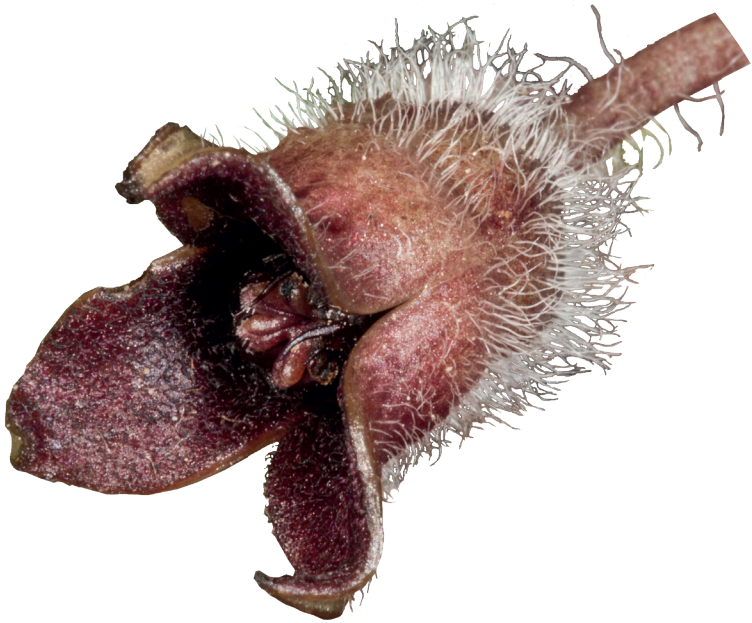
HASELWURZ Asarum europaeum